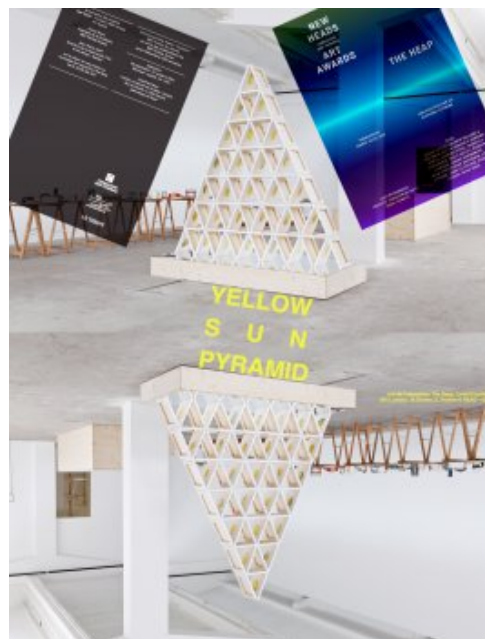
Photo HEAD - Baptiste Coulon et Sandra Pointet ' type="image/jpeg">

Yellow Sun Pyramid, installation de 77 peintures à l'huile sur toile et miroir. Photo HEAD - Baptiste Coulon et Sandra Pointet